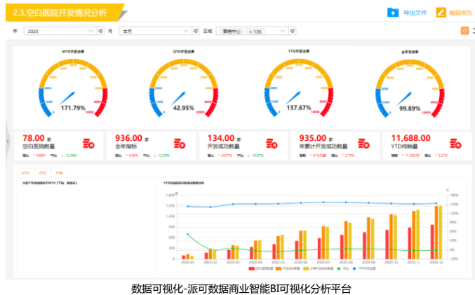
数据可视化-派可数据商业智能BI可视化分析平台

2025年到来之际，中医药行业整体规模将得到进一步的强化，届时随着中医药人才以及中医药机构的增加和扩散，中医药的认可度也会进一步提升，并且中医药人才的培养和需求也会将中药的使用普及到更多人群，将中草药材、中药饮片和成药的使用向全国范围推动。