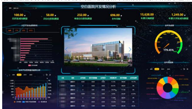
数据可视化-派可数据商业智能BI可视化分析平台

中药行业一直都是我国传统行业里备受关注的领域，中药的细分药品也是受到争议最小的，相关的中药企业也都有着悠久的历史，长期在大众的关注里成长，也得到了广泛的认可。